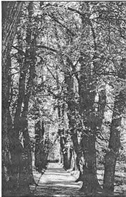
Алея Керн. Міхайлаўскае

У гарах Вялікага Каўказа ў Бакавым хрыбце Кабардзіна-Балкарый паміж вяршынямі Дых-Таў (5203 м) і Коштан-Таў (5151 м) размешчана вяршыня Пушкіна